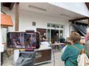
Foto rechts: Beilngries, Führung durchs Klärwerk