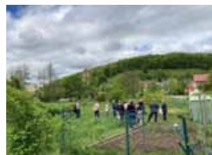
Foto links: Berching, im Zeichen von Citta Slow