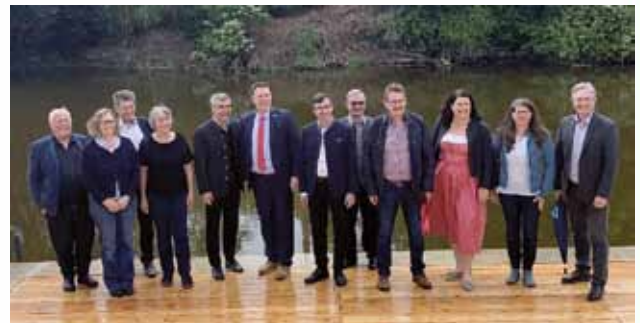
In Kipfenberg kamen zahlreiche Ehrengäste zur Einweihung des LEADER-geförderten Bootsrastplatzes an der „Bullenwiese“.