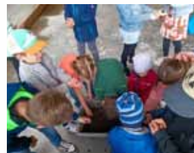
Foto rechts: Titting, Schauscheren