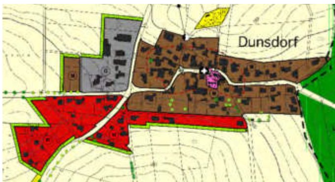
Flächennutzungsplan (12. Änderung):