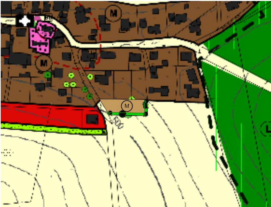
FNP Kipfenberg nach der Änderung