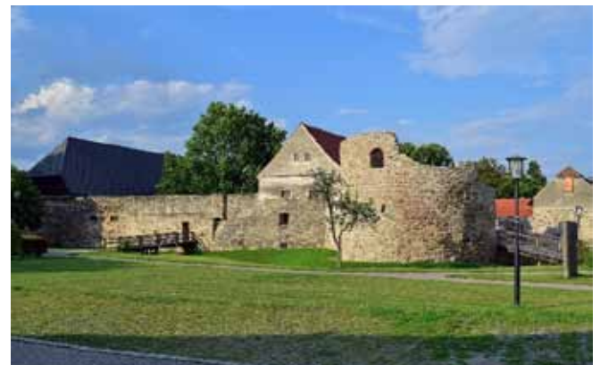
Foto: Donaukastell Vavians, Mautern, Österreich

Seit Juli 2021 sind die „Grenzen des Römischen Reiches – Donaulimes (westliches Segment)“ UNESCO-Welterbe. Das war sogar der Tagesschau eine Meldung wert.