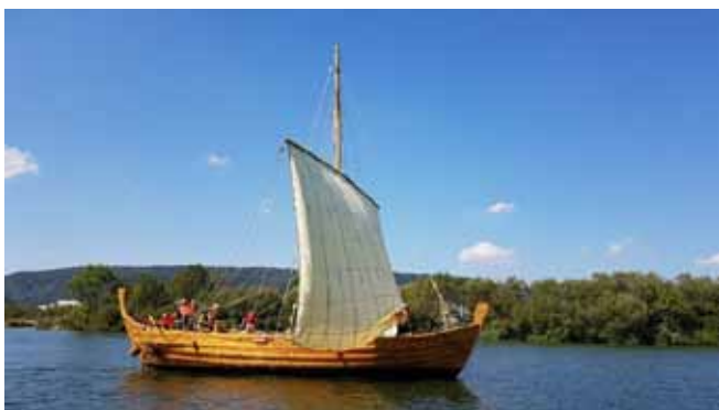
Foto: Römisches Handelsschiff Bissula im Praxistest