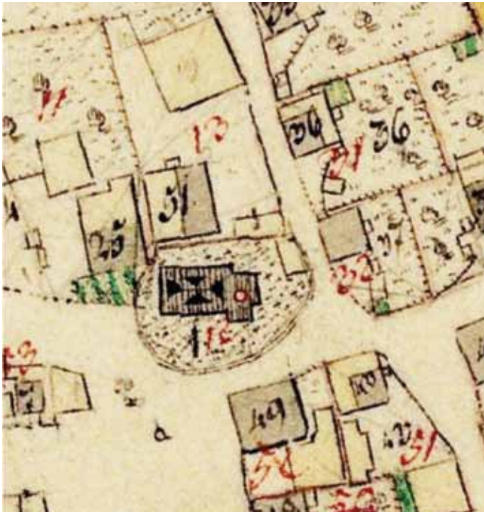
Urkatasterplan von 1813 mit Wehrkirchhof (alter Friedhofsmauer) und Mayerhof gleich daneben, mit 51 bezeichnet.