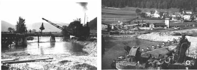
Abbruch der alten und Neubau der neuen Betonbrücke, 1928

Danach wurde die alte Brücke abgebrochen und durch eine Betonbrücke ersetzt. Unterhalb erfolgte ein Durchstich, wodurch ein Altwasser entstand, in das der Quellbach von Englgrösdorf mündete.