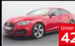
Unser Barpreisangebot 42.950 €

EZ 09.2019, 71.500 km, Automatik, Einparkhilfe, Tempomat, Klimaautomatik, Lederlenkrad, Leichtmetallfelgen, Multifunktionslenkrad, Navi, Sitzheizung, Sportpaket, Xenon-Licht, bluetooth uvm.