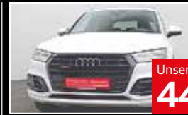
Unser Barpreisangebot 44.850 €

EZ 07.2018, 40.300 km, Automatik, Allrad, Abstandstempomat, Einparkhilfe Kamera, LED-Scheinwerfer, Massagesitz, Navi, Alcantara, Sitzheizung, Soundsystem, Spurwechselassistent, volldigitales Kombiinstrument uvm.