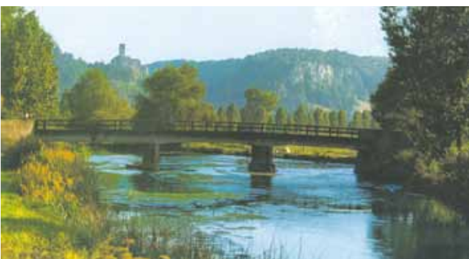
Die Grösdorfer Brücke mit der Burg Kipfenberg und dem Michelsberg als Fotomotiv