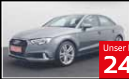
Unser Barpreisangebot 24.450 €