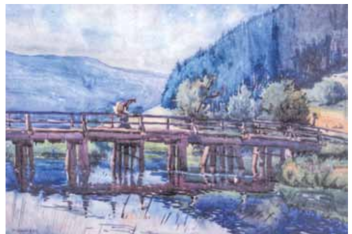
Aquarell von Franz Ermer, 1909

Neben dem Fotodokument gibt es ein Aquarell des Kipfenberger Künstlers Franz Ermer, der die Brücke schon früher eindrucksvoll in Szene setzte. Über diese geht eine Bauersfrau mit Rückenkirm, einer „Buckelkraxn“, in der Hand trägt sie einen Rechen. Dieses Bild kann als Denkmal einer vergangenen Welt angesehen werden.