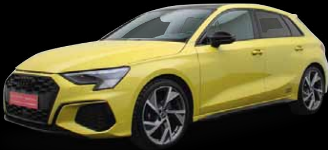
Audi S3 Sportback Edition One 2.0 TFSI, 228 kW (310 PS) quattro, S tronic

EZ 05.2021, 9.400 km, Automatik, Allrad, Abstandstempomat, Einparkhilfe Kamera, elektr. Heckklappe, LED-Scheinwerfer, volldigitales Kombiinstrument, Navigationssystem, Panoramadach, Polster/Leder, Sitzheizung, Soundsystem, Head-up-Display uvm.