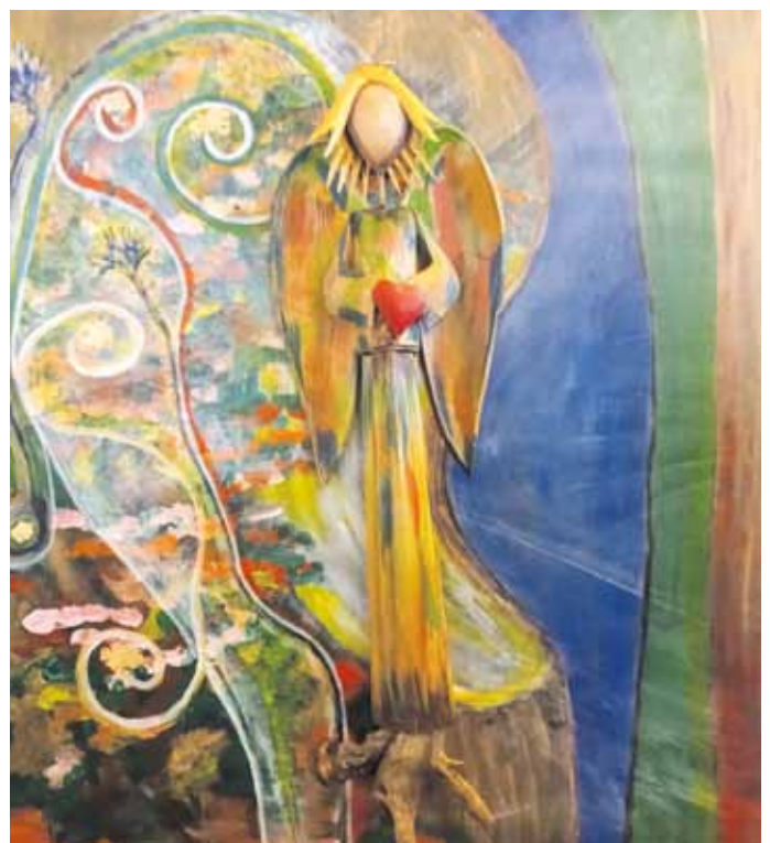
„Naturengel“ von Gabriele Dotzauer

Es wird ein Highlight sein für Kunst- und/oder Naturliebhaber. Über die Inspiration durch die ausgestellten Werke hinaus lädt dieses Event dazu ein, einzutauchen in das Ambiente einer Naturlandschaft mitten im Herzen von Kipfenberg.