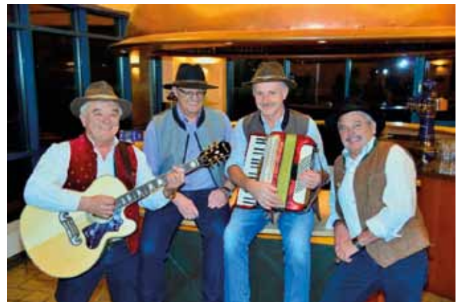
Abb.: Gopperer 4: Bayrisches Musikkabarett live im Museum Der Eintritt ist frei. Für die Musikanten wird mit Hut gesammelt. Anmeldung wird erbeten bis Do, 26. Mai, Tel. 08465/905707.