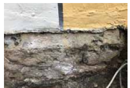
Abgeschrägter Quader im Fundament des Kirchturms