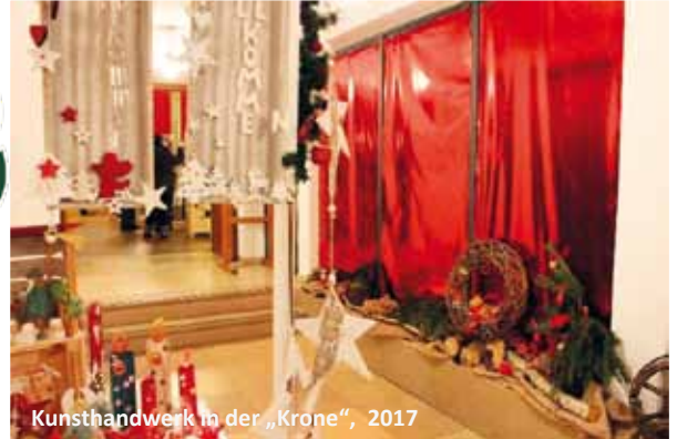
Kunsthandwerk in der „Krone“, 2017