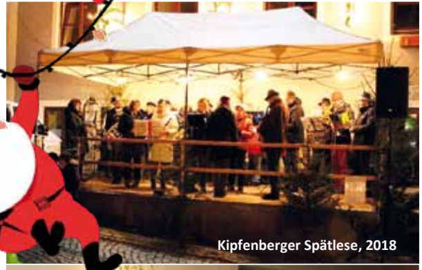
Kipfenberger Spätlese, 2018