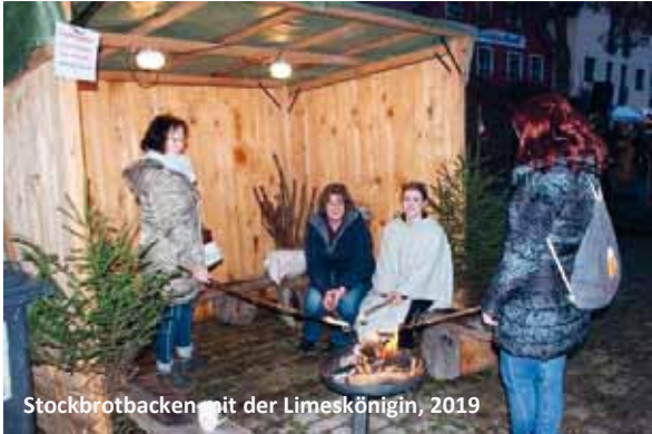
Stockbrotbacken mit der Limeskönigin, 2019