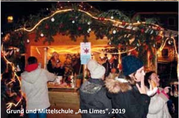
Grund und Mittelschule „Am Limes“, 2019