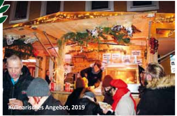
Kulinarisches Angebot, 2019