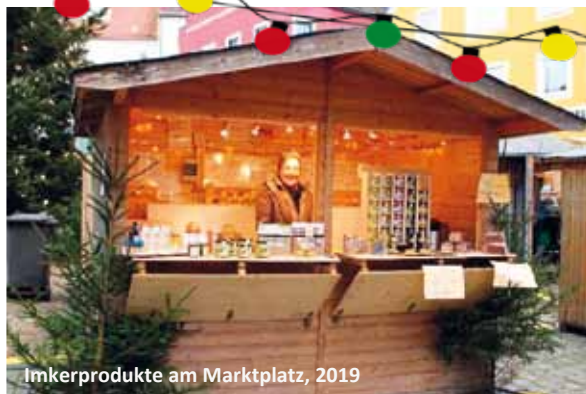
Imkerprodukte am Marktplatz, 2019