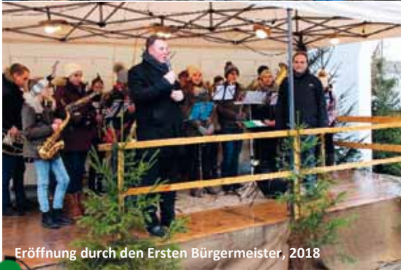
Eröffnung durch den Ersten Bürgermeister, 2018