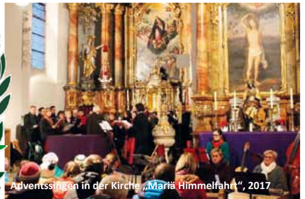
Adventssingen in der Kirche „Mariä Himmelfahrt“, 2017