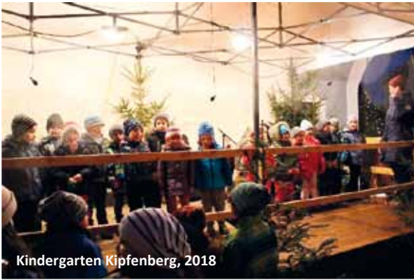
Kindergarten Kipfenberg, 2018