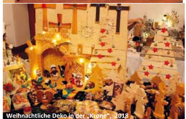
Weihnachtliche Deko in der „Krone“, 2018