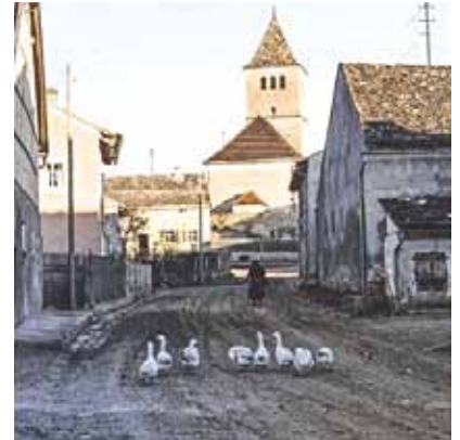
Die erhöht liegende Kirche von Pfahldorf