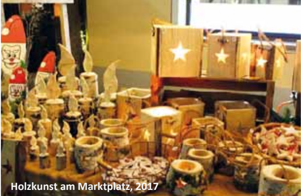
Holzkunst am Marktplatz, 2017