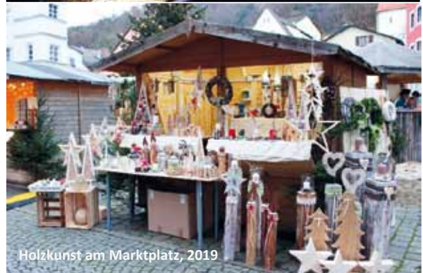
Holzkunst am Marktplatz, 2019