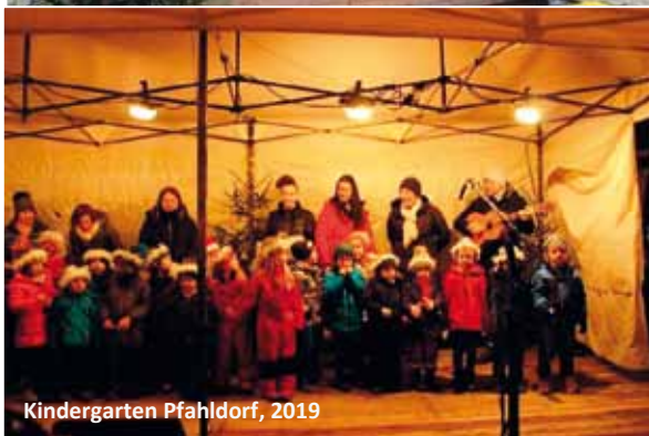
Kindergarten Pfahldorf, 2019