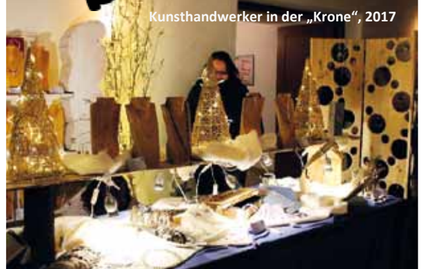
Kunsthändler in der „Krone“, 2017