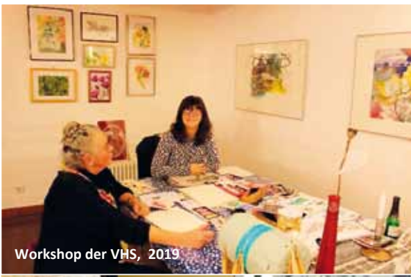
Workshop der VHS, 2019