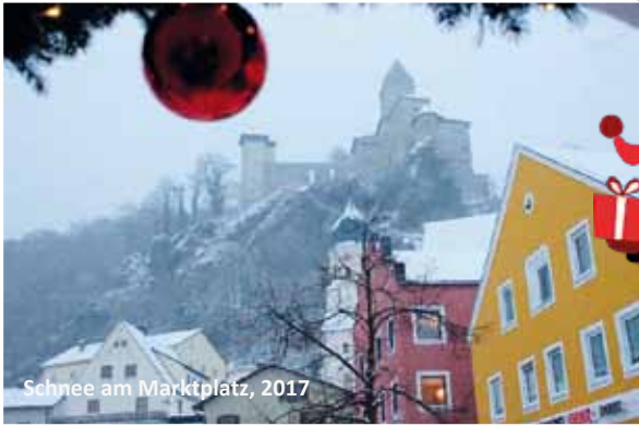
Schnee am Marktplatz, 2017