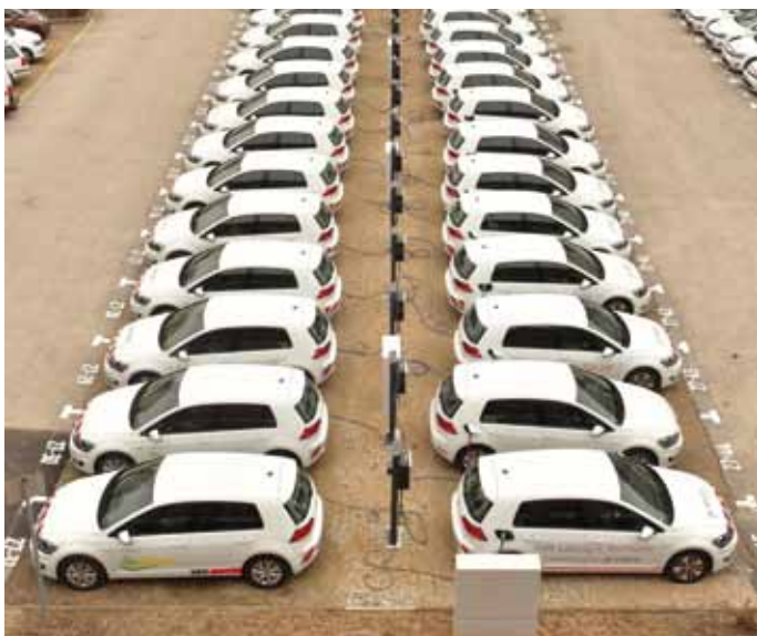
Über 120 Elektrofahrzeuge hat die N-ERGIE Aktiengesellschaft in ihrem Fuhrpark im Einsatz. Hinzu kommen 180 Ladepunkte an Unternehmensstandorten sowie 260 eigene öffentliche Ladepunkte.