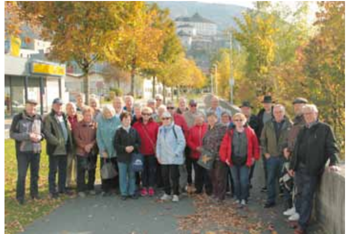
Die Vereinsmitglieder an der Flusspromenade des grünen Inn's. Im Hintergrund die Festung Kufstein. Bericht & Foto: Thomas Weidenhiller

sen, die Römerhofgasse. Eine schmale Gasse, mit kleinen Erkern, kleinen Fenstern mit weißen Sprossen, historische Lokale mit Malereien an den Häuserwänden..., ein Ort zum Staunen. Am Flussufer des grünen Inn's ging es dann wieder zurück zum Omnibus. Bei Allersberg wurde dann noch ein Halt für eine deftige Brotzeit gemacht. Die Kameraden und Kameradenfrauen erlebten einen schönen Ausflugstag bei Kaiserwetter und warten schon darauf, bis das nächste Ausflugsziel bekannt gegeben wird.