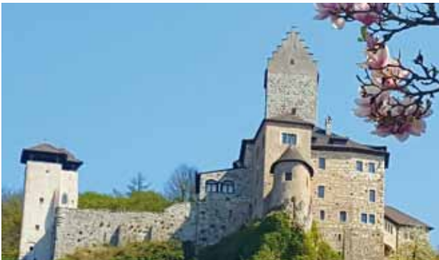
Burg Kipfenberg