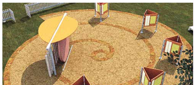
Entwurfsplanung Garten der Bavaria Buche

Mehr als 30 Besucher trafen sich am 19. Februar in Pondorf, um sich über den aktuellen Stand des Leaderprojektes „Gedächtnisgarten Bavaria Buche“ zu informieren. Hierfür wurden knapp 36.800 Euro bewilligt. Die Bauarbeiten sollen in den nächsten Wochen beginnen.