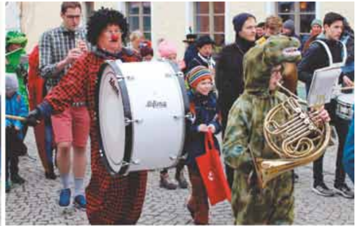
Kipfenberger Faschingsumzug 2019